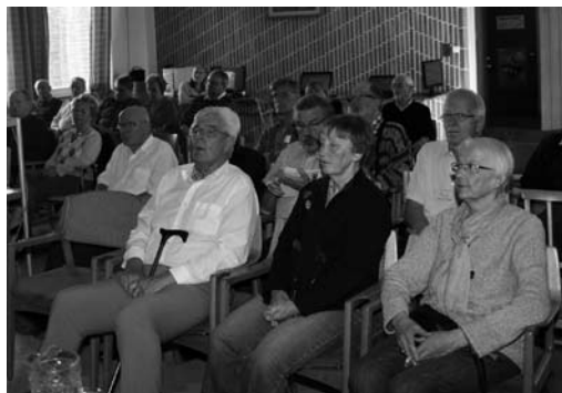
Publiken lyssnar andäktigt på Hugos föredrag