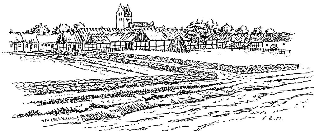
1700-tals rusthållshemmanet nr 48 i Trelleborg, sett från söder.

Enligt notis i Trelleborgs Tidningen omfattade myntfyndet från maj 1934, 2 752 identifierade myntstycken, de flesta