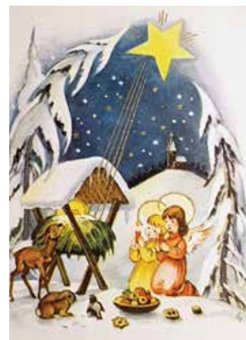
Julkort från 1955

Guds öga är från altarfönstret i Johanneskyrkan i Malmö