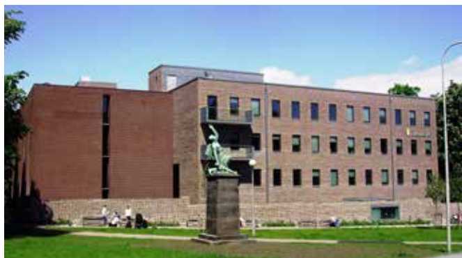
Landsarkivet i Göteborg