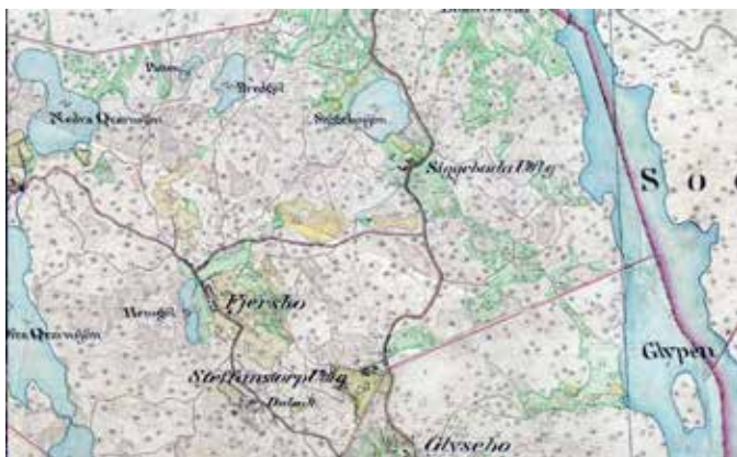
Karta Kristianstad län 1930 överst, Östergötland 1870 nederst