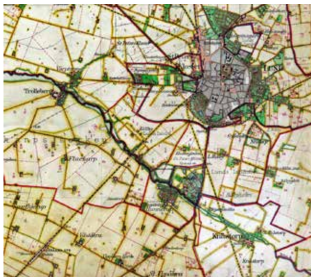
St. Uppåkra Nr 6 ligger rakt ovanför t i St. Uppåkra. Men var låg Bomhuset?

Jag vet inte ännu – fortsättning följer hoppas jag, i de olika arkiv som kan finnas från polisen i Lund och Malmö. Dessutom hoppas jag på justitieminister Bodströms förslag om förlängning av preskriptionstiden för grövre brott. Om min egen forskning inte skulle ge resultat ska jag i stället be polisen att på nytt utreda rofmodet vid Höjebro.