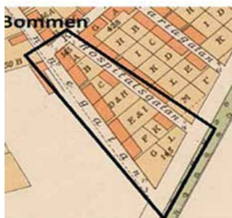
Kvartersutsnitt över kvarteret Bommen med de omgivande gatorna Korsgatan, Hospitalsgatan, Södra Esplanaden och Prennegatan.

Så här går det till att få ett lösenord till databasen