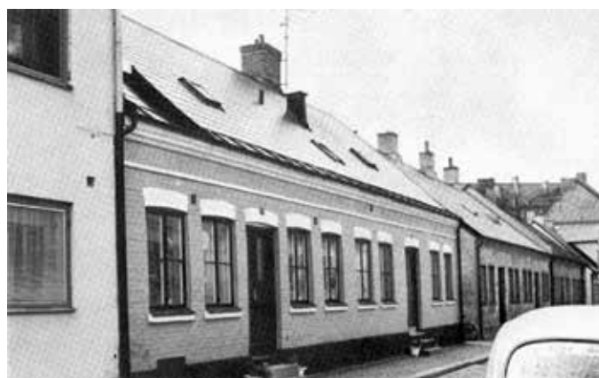
Prennegatan 17, Bommen 2

När du fått lösenordet går du in på föreningens hemsida. Under Projekt hittar du Lund inom vallarna . Där finns en länk som du klickar på för att komma åt databasen.